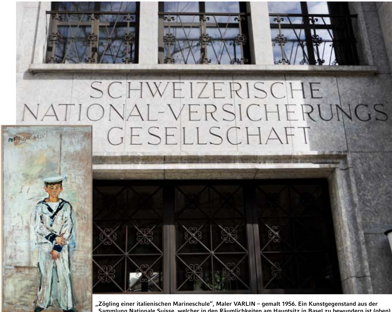
„Zögling einer italienischen Marineschule“, Maler VARLIN – gemalt 1956. Ein Kunstgegenstand aus der Sammlung Nationale Suisse, welcher in den Räumlichkeiten am Hauptsitz in Basel zu bewundern ist (oben).